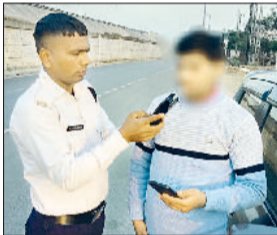
रेवाड़ी। चालकों में शराब की मात्रा की जांच करती पुलिस।