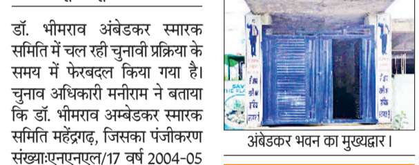
अंबेडकर भवन का मुख्यद्वार।