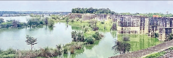
रेवाड़ी। साहबी बैराज में जमा प्रदूषित पानी।