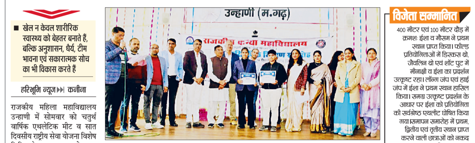
उन्हाणी (म.गढ़)। राजकीय महिला महाविद्यालय के छात्राओं को सम्मानित करते मुख्य अतिथि व अन्य।

खेल न केवल शारीरिक स्वास्थ्य को बेहतर बनाते हैं, बल्कि अनुशासन, धैर्य, टीम भावना एवं सकारात्मक सोच का भी विकास करते हैं