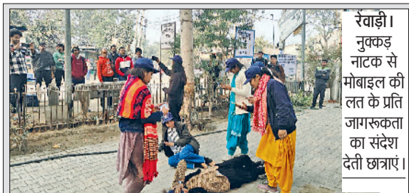
रेवाड़ी। नुकड़ नाटक से मोबाइल की लत के प्रति जागरूकता का संदेश देती छात्राएं।

नब्बे के दशक में केंद्र की राजनीति में प्रवेश कर चुके राव इंद्रजीत सिंह वर्ष 1998 में महेंद्रगढ़ लोकसभा क्षेत्र से सांसद बने थे। एक साल बाद हुए मध्यवर्धि चुनावों में चली कारगिल लहर में भाजपा प्रत्याशी डा. सुधा यादव ने भी खिलाड़ी होते हुए भी राव को मात देकर सभी को चौंका दिया था। इससे अगले चुनाव में राव ने सुधा से भी हाथ का हिसाब बराबर कर दिया था। सुधा को भी इसके बाद दूसरी बार संसद पहुंचने का मौका कमी नहीं मिला।