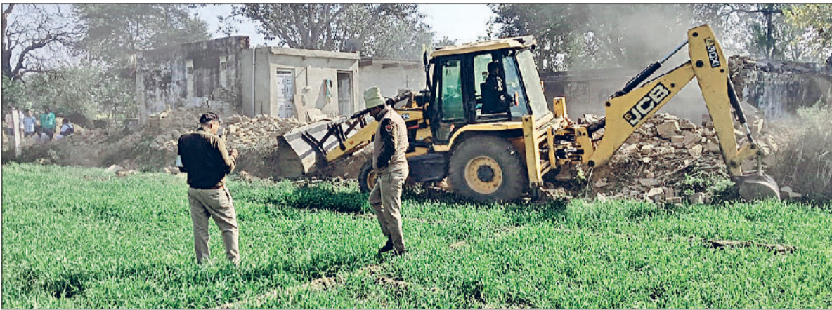
रेवाड़ी। एक गांव में अवैध कब्जे हटाती हुए टीम।

लंबे समय से कई गांवों में पंचायती जमीनों से लेकर रास्तों और जोड़ड़ की जमीन पर पक्के मकान बनाए हुए हैं। विलेज कॉमन लैंड एक्ट के तहत पंचायती जमीनों को खाली कराने की प्रक्रिया तेजी से अमल में लाई जा