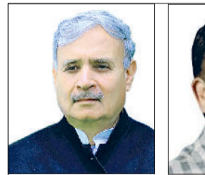
राव इंद्रजीत सिंह।