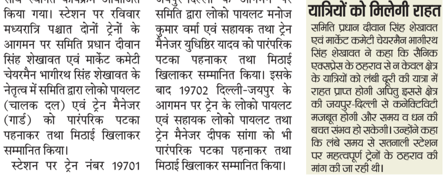
सतनाली। सैनिक एक्सप्रेस के ठहराव पर लोको पायलट एवं ट्रेन मैनेजर का स्वागत करते समिति सदस्य।

रेल के ठहराव से जयपुर-दिल्ली की कनेक्टिविटी होगी मजबूत