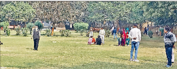
रेवाड़ी। सोमवार को नेहरू पार्क में धूप सेकते लोग।