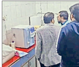
रेवाड़ी। लैब पर जांच करते हुए सीएम फ्लाइंग टीम, लैब को सील करते हुए सीएम फ्लाइंग टीम।

विभिन्न प्रकार की स्वास्थ्य जांच करने वाली लैबोरेट्रीज पर किसी कदर अनियमितताएं बरती जाती हैं, उसका उदाहरण एक बार फिर देखने को मिला। सीएम फ्लाइंग टीम ने धरुहड़ा में लैब जांच करते हुए तीन लैबोरेट्रीज को सील कर दिया। इन लैब पर भारी अनियमितताएं पाई गईं। लैब संचालकों के खिलाफ कार्रवाई